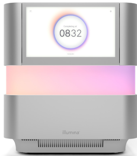
Abbildung 1: Das NextSeq 2000-Sequenziersystem: Das neueste NGS-System von Illumina zeichnet sich durch innovative Merkmale, fortschrittliche Chemie, vereinfachte Bioinformatik und einen intuitiven Workflow aus, wodurch ein bislang unerreichtes Spektrum an Aufgaben auf einem Tischsequenziersystem erledigt werden kann.