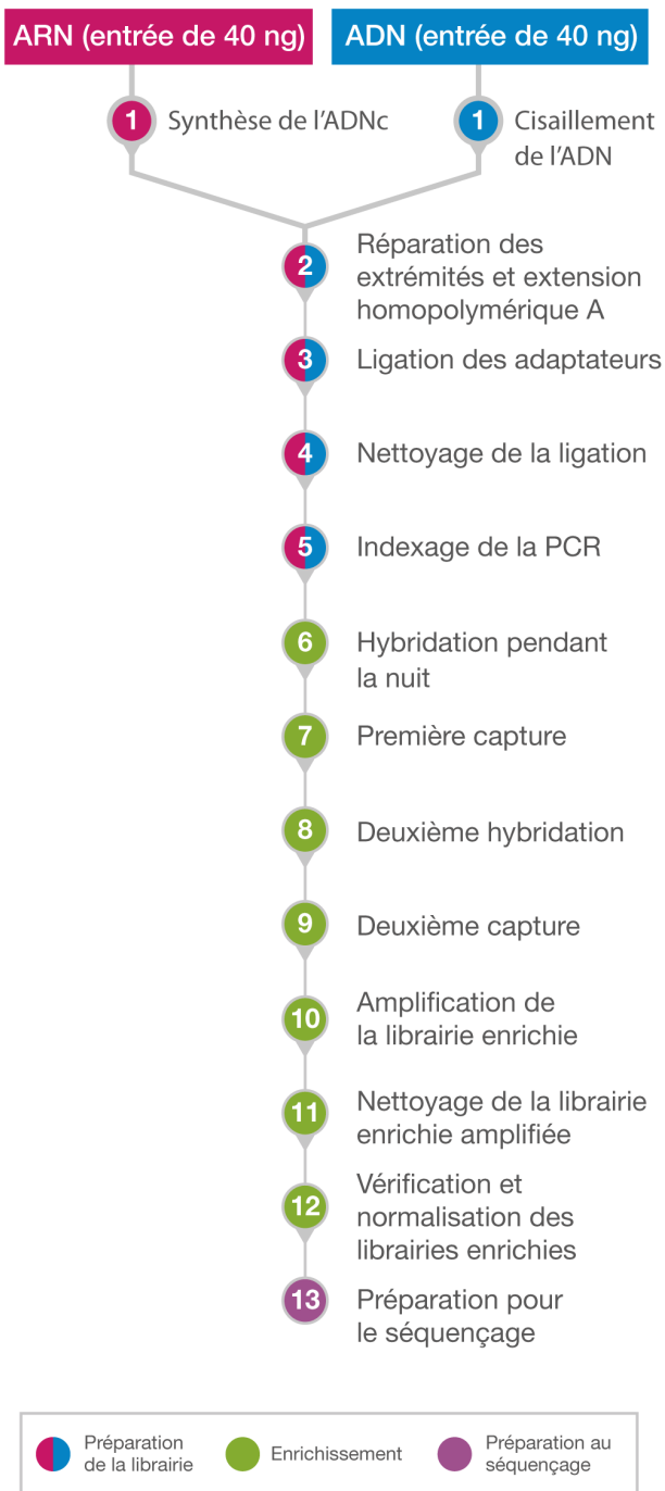
Figure 2 : Flux de travail de préparation de bibliothèques combiné : Les échantillons d'ADN et d'ARN passent par le même flux de travail après l'étape de synthèse de l'ADNc (pour l'ARN) et de cisaillement (pour l'ADN).