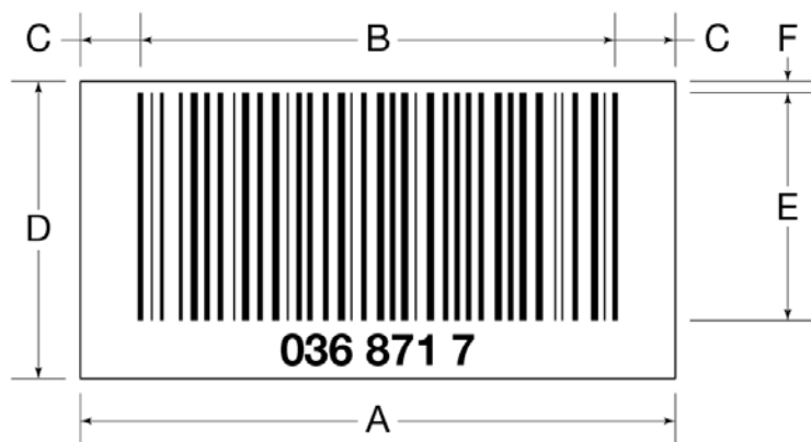
Figur 2 Strekkodedimensjoner