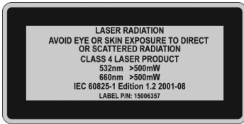
Figure 1 Class 4 Laser Warning