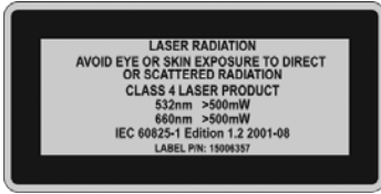
Figura 1 Advertencia de láser de clase 4