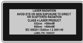
Figure 1 Laser de classe 4 : mise en garde