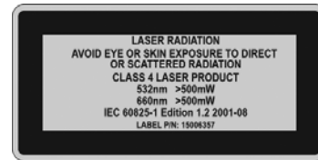
그림 1 4등급 레이저 경고